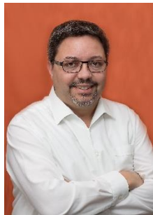
Vizepräsident: Ulrich Heun